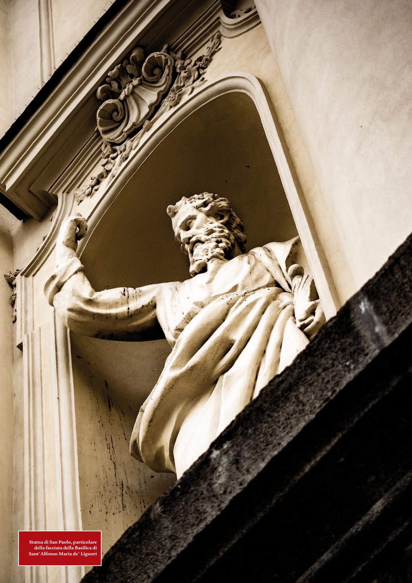
Statua di San Paolo, particolare della facciata della Basilica di Sant'Alfonso Maria de' Liguori